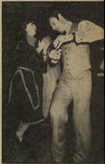
זוג רוקר בקאהיר רומאן עם '78