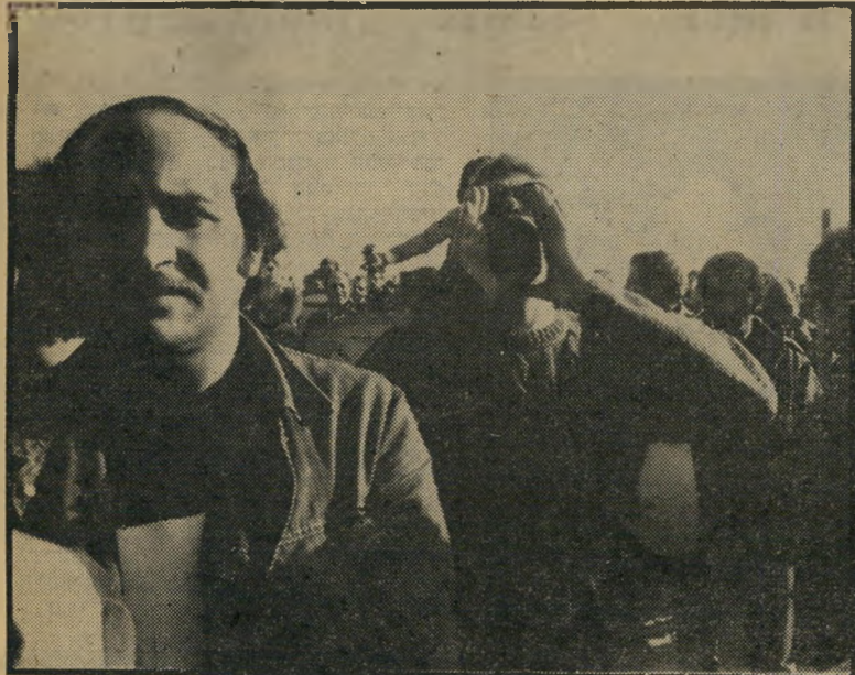
תושב שדות קורא, "בוז!" "איזה דגל יתנוסס בפיתחת-רפיה?"