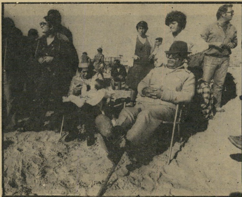
תושב הפיתחה מאזין מנוחת המפגין