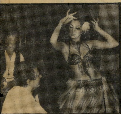
אייביבי ורקדנית בסן בישראל — על העליונה

רקדניות בסן. האם בשביל זה צריך לניסוע עד מצריים?