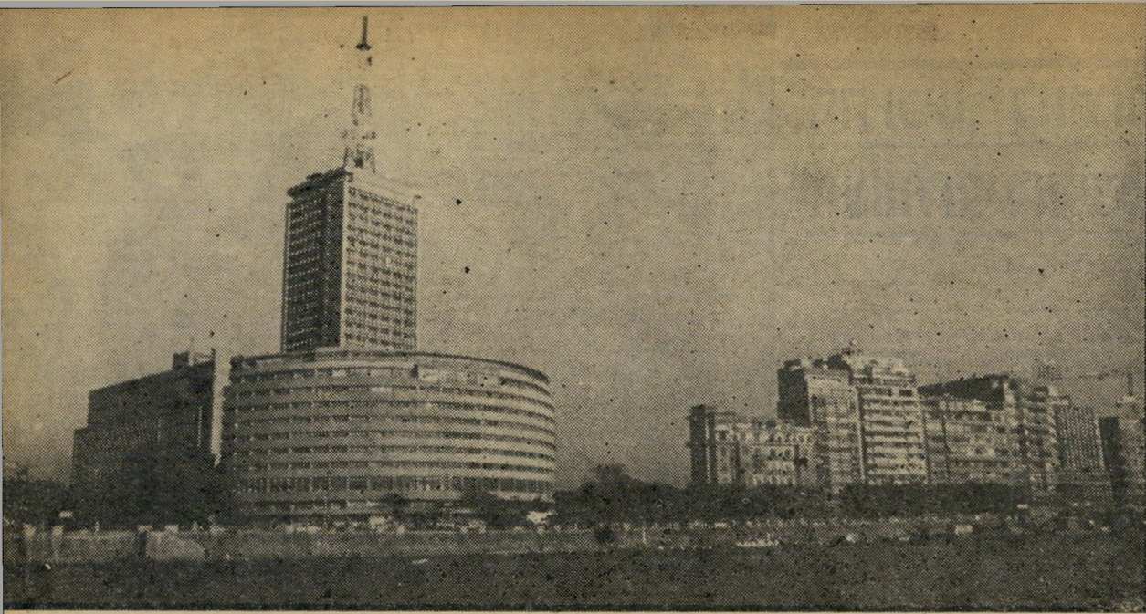
בניין הטלוויזיה בחוף המזרחי של קאהיר, ברחוב קורניש שלאורך הנהר,