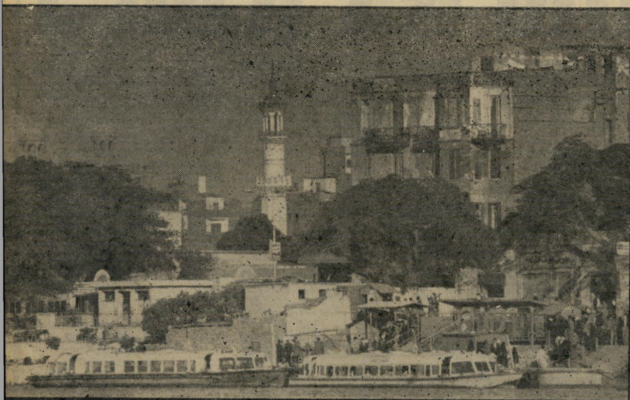
חנות מעבורות של אוטובוסים ימיים באחד מפדברי קאהיר