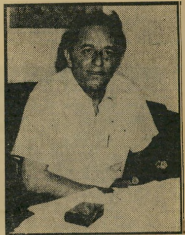
ממונה ברקת אין אמצעים

דרך אחרת, כאשר המושביניק קונה ציוד עליו מגיע החזר. את הציוד קונה