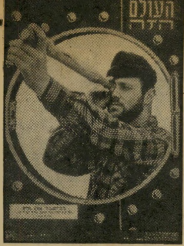
העולם הזה 790 תאריך: 18.12.52

בגליון, "העולם הזה" שראה אור לפני 25 שנים בדיוק, תחת הכותרת "אני רכיחובל", הובא סיפורו של אדן גרין, רכיחובל היפאי צעיר בן 24, שספג מושמרה החופים האמריקאי ומפוסו דלקו אחר אוניותו, א/ק, "אכרסה גרין". בגלילה הפך הצעיר החיפאי מרכזה של סנסציה עולמית, כאשר הפלית בלא רשות ממל ניויורק אחרי שהסתבר לו כי אביו נאלץ למכור את אינתינו לחברת-השיט "סהם" (צ"מ). מלכיים שלה אדן גרין מוכר לדוד כן-גוריון, וכן הודעה שימכיע את אוניותו בלבדים או יהפכנה ל"אלטלנה" שנייה, אם לא ימנה זה את אביו כשריחובל. במדור "במדינה" סוקר טכס השבעתו של יצחק כן-צבי כנשיאה השני של מדינת ישראל. בין תצלומי הנוכחים בכנס,