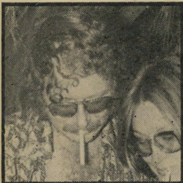
אדריכל שרון כיכר תלוייה

אלפי אדריכלים בעולם משלימים בימים אלה את התוכניות למיכרז בני-לאומי שהוציא השאה הפרסי להקמת סיפרייה. המועד האחרון למיכרז הוא סוף החודש שעבר. בישראל עוסק במרז רב בתוכנית אלה