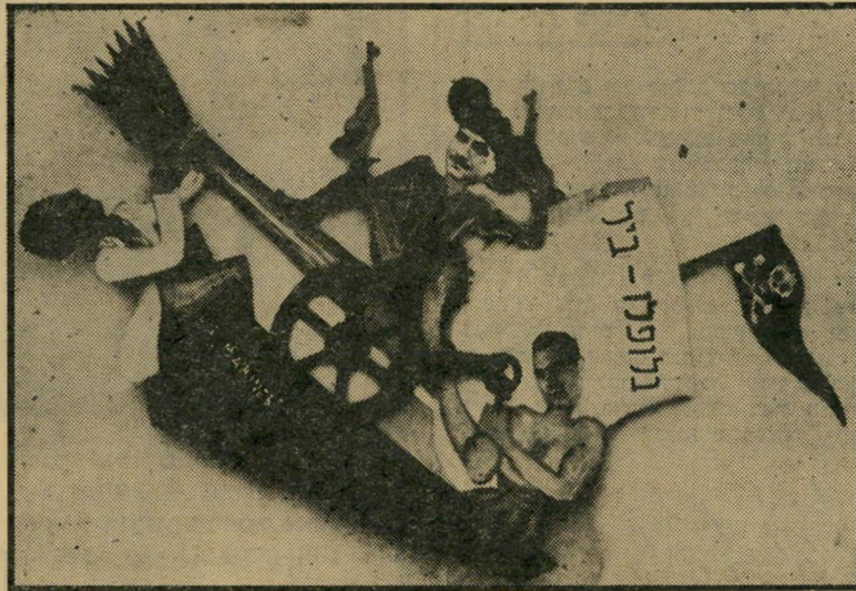
ביל שפירא בכרזה פורומית של מטה המישטרה — שהורשע ברצח