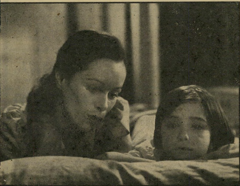
אנה טורנט וג'רלדין צ'אפלין ב"קריאת העורב" הערצה עיוורת לאם

שיום רבים ורק עתה הוא עומד לצאת המחוסן אל הבר. זאת, בתנאי שבעלי הקולנוע נוע — המיואשים מגובה היטלי העינוגים על הכרטיסים שהם מוכרים — לא יכריזו לפני-כן שביתה.