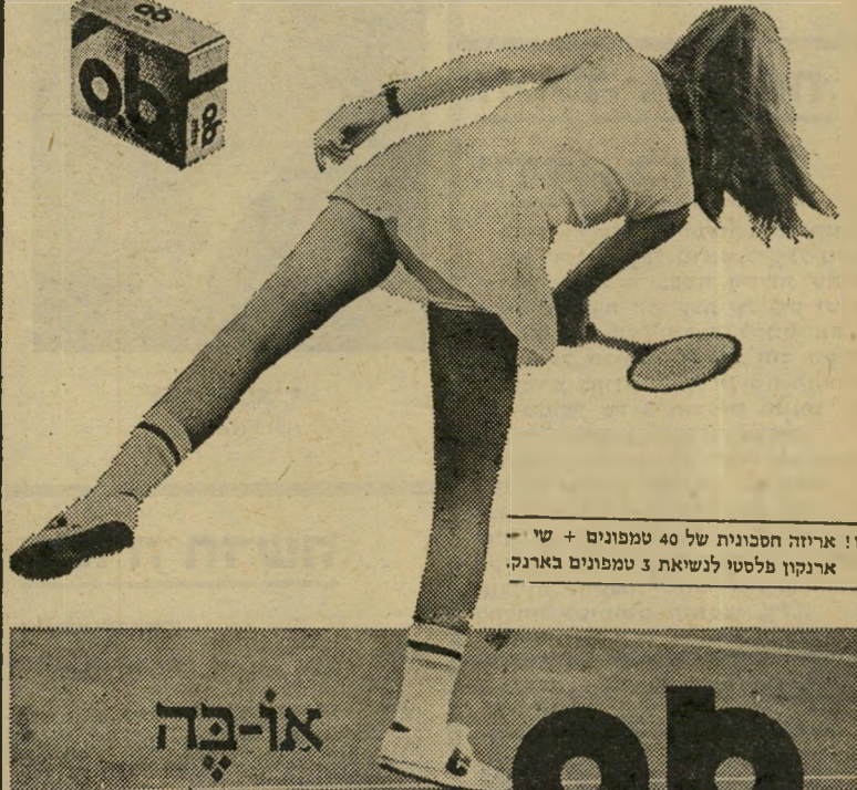
חדש! ארוזה חסכונית של 40 טמפונים + שי-ארנקון פלסטי לנשיאת 3 טמפונים בארנק.