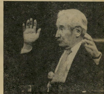
מרואיין גולדמן בילוש בחדר המיטות?

ג'ו גולדן, איש-המוסתורין שקשר למען גולדמן נקשרים עם המחותרת הי-אג'ירית. עם מארוקו ועם כמה מחותרות אחרות, גרם לסערה הראשונה. אחרי שי-השגריר-לשעבר בצרפת, יעקב צור, מתח ביקורת על פעולה זו של גולדמן, זרק גולדן פצצה: ישראל רצתה רק בעלייה סלקטי-בית מצפון-אפריקה. גולדמן הכריח אותה לקבל את כל היהודים, ”בלי סלקציה.” חילופי-דברים זועמים. אגמון ביקש את אורי אבנרי לסכם את מהות המחלוקת ההיסטורית בין גולדמן לבין ממשלת ישראל. אל. אבנרי: ”לגולדמן היתה תפיסת-יסוד