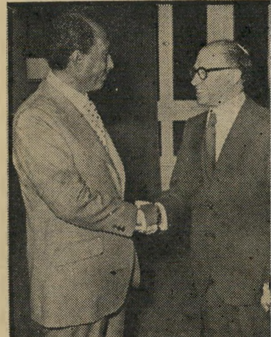
מנחם בגין ואנוואר אל-סאדאת החיים כספורט או הספרות כחיים

מילטון רפט ממריא לדומא, על מנת לדווח לעורכו על התוצאות. מתוך דיווחו מסתבר מהפך מסויים: "מוזר כיצד נתיחלפו לפתע עמדות הצדדים. שנים רבות ניסו נציגי פלוטוניה העילית, בכל הכמות הבנלאומית ובכל פוגי התמרונים, להביא לידי פגישת פנים-אל-פנים עם נציגי פלוטוניה התחתית, פגישה כלשהי שיהיה בה משום הכרה רשמית ופומבית של פלוגי פלוטוניה התחתית בקיום מדינתם. באותה עקשנות התחמקו נציגי פלוטוניה התחתית