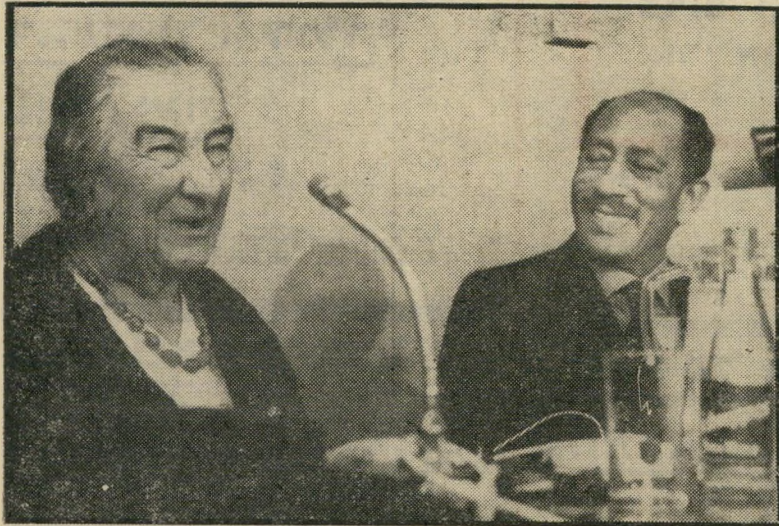
גולדה וסאדאת במישכן הכנסת בירושלים מוסר-השכל וגועלי-נפש

היתה זו תחילתו של סיפור אהבה רותח. בעקבות החיבוק הצנוע, עבר הזוג ה- מפורסם לריקוד סגור צמוד, המשיך בהת- עלטות מרהיבת עין, לפי מיטב כללי ה- מסורת של הצגות מועדוני-הליילה המפור- סים של מונמרטור, כשהצופים מקבלים תמורת כספם לא רק גועלי-נפש, אלא גם מוסר-השכל - ומה עוד אפשר לבקש תמורת כמה פראנקים?