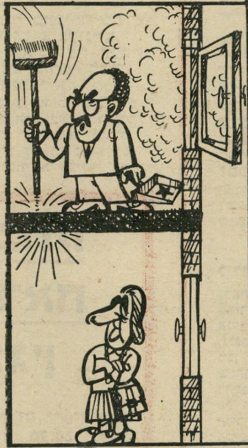
ציור של דריאן (ה.ה. 1821) שקט בבקשה!