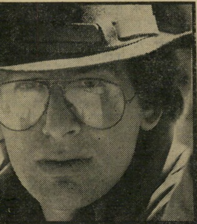
כמאי סמיכן שפילברג "כמעט קיבלתי התקף-לב"

הפרוטסטנטי שנלחם באמונת אבותיו, וחניך היישובים שהפך את ההתעללות בכנסייה לתחביב, מצאו סוף-סוף שפה משותפת?