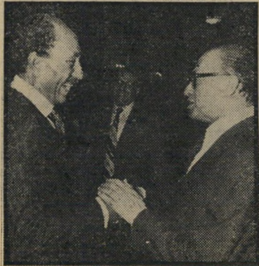
כאשר ידין החל לאמר משהו לנשיא המצרי, נכנס בגין לדבריו של ידין, כאילו ולא הבחין כלל בכך שסגנו מדבר.