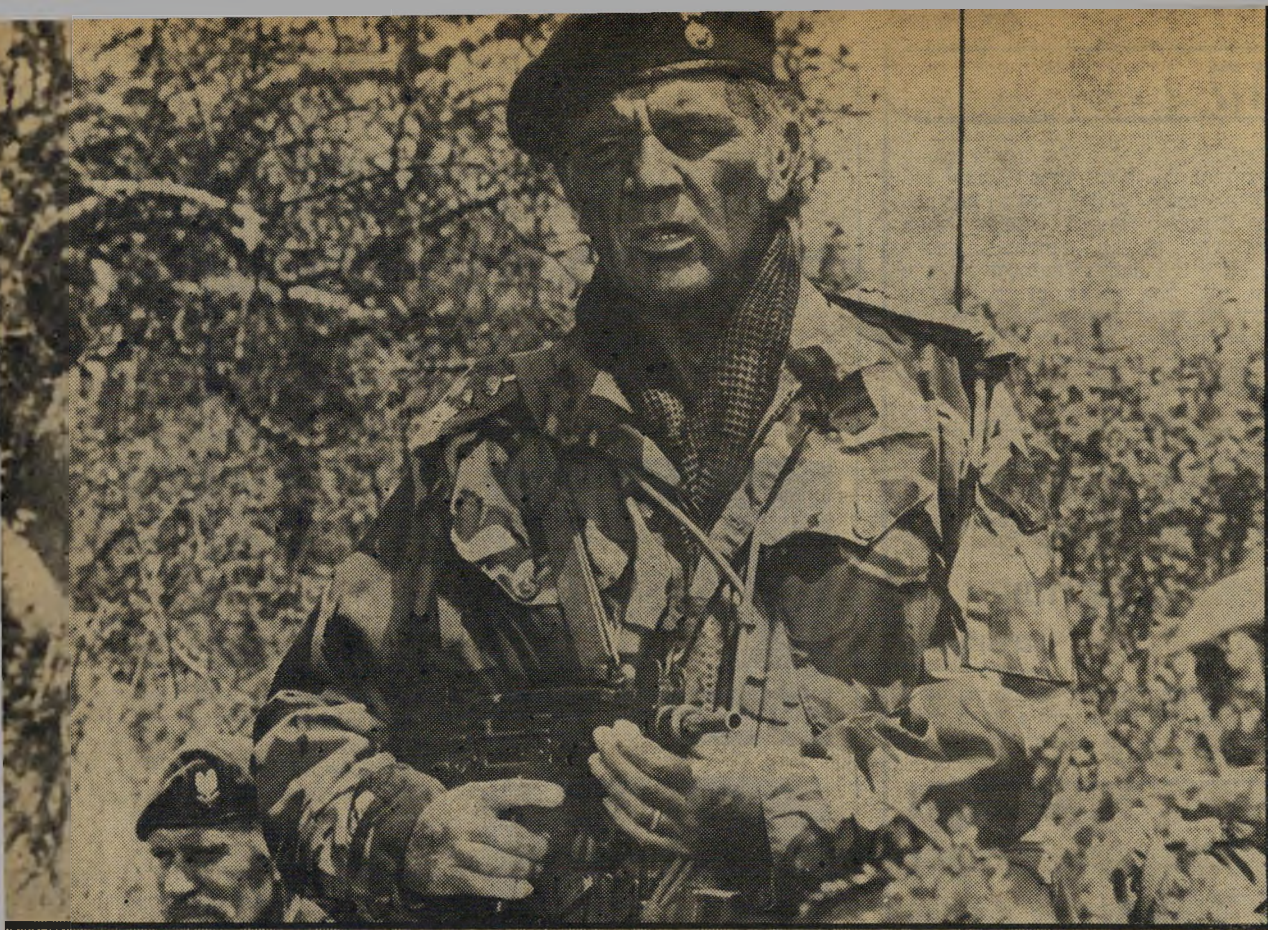
שחקן ריצ'ארד ברטון מחזיק "עוזי" בידו כ"אוזי הפרא" המחיר - 12 מיליון. כמה עלה ה"עוזי"?

בעידוד בעלה דאו, המחזאי קליפורד אודטס, היא פרשה מהוליווד כדי להופיע במחזה. בניתיים התגרשה מבעלה, וישאה בשנית, הפיעה על הבמה האנגלית וחזרה בפעם האחרונה לקולנוע ב-1943, בסרט בשם בני ערובה. התוצאה לא גירתה אותה להמשיך. מאז היא מופיעה לעיתים