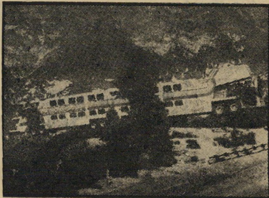
אוטובוס התשוקות: גם מרגע לרגע

הצרים מזכירים ברמתם את המערכונים הפחות-מוצלחים מתוך אהבה נוסח אמריקה (שכמה משחקניה קבועים מופיעים כאן) קשה להתפעל מן המוצר הסופי.