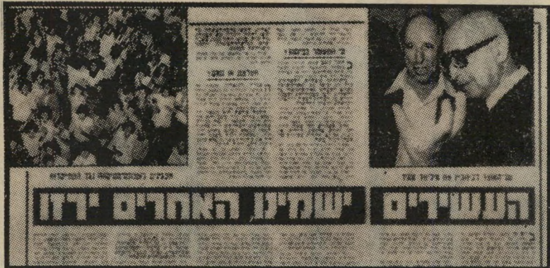
הכתבה על הפיחות, "העולם הזה" 1941 (13.11.74) הוראה מפורשת

"המדיניות הכלכלית החדשה נושאת על פרצופה את תווי-הפנים של ממשלה זאת, של ממשלה כזאת", הגיב העולם הזה על המדיניות הכלכלית של רבינוביץ (העו' 1941). אין ספק, דרושה מדיניות חדשה, דרושים קורבנות, הוויכוח אינו על הצורך במדיניות ובקורבנות, אלא על ה'