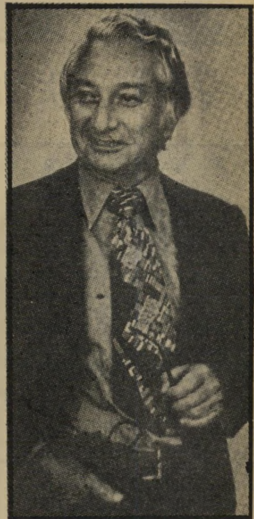
אידי-עפקים ריקלים מי הרוויח ראשון?

המיליונר הישראלי-אמריקאי משולם ריקליס (53) בנה אימפריית עסקים אדירה, המבוססת כמעט רובה-הכולה על אשראי. הוא משלם תמורת רכישותיו באיגרות חוב, שאותן הוא מכנה בליגלוג, "רובלים רוסיים", ובערובות, שאותן הוא מכנה "פזוס של קאסטרו".