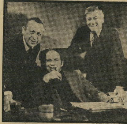
רפאל, שני וברגר מה הקשר?

בשקט-בשקט החזיר מישרד-המיסרד והתעשייה לחברת הסרטים "האחים וורנר" את הפיקדון שהפקידה בשעתו כי התחייבות שתפיק בישראל את הסרט על מיבצע אנטבה. "וורנר" הפקידה 750 אלף דולר, ואחרי שנסוגה מן התפקה הודיעה לה ממשלת ישראל, כי הפיקדון לא יוחזר, כיוון שהמרה את תנאי החוזה. עתה הוחזרו לה 650 אלף דולר, ו-100 אלף דולר נשארו במישרד כקרן לעזרה לסרטים. הממונה על עידוד הסרט הישראלי נשאל מי הורה להחזיר את הפיקדון.