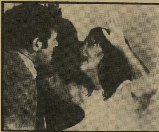
סוויפט והופקנים — הנשמה נודדת

שמה ברז'יט פוסי, ובקרוב אפשר יהיה לראותה על הבד בישראל, בסרטו החדש של פרנסואה טריפו, האיש שאהב נשים. היא מגלמת בו תפקיד מפתח, כהתגלמות האשה החדשה, העצמאית והחזקה האחראית להדפסת סיפורו של ברטראן מוראן (שארל דנר) שהוא האיש שאהב נשים. בהלווייה של מוראן, שבה נפתח הסרט, קולה של ברז'יט פוסי הוא המציג בפני הצופים את הגיבור המנוח והמעיר, למראה כל הנשים שבאו להלווייה (אין בה אפילו גבר אחד): "הוא היה נהנה מן ההלווייה שלו". מאוחר יותר, כאשר המצלמה סוקרת בהתפעלות את הרגליים החטובות של הגברות מנקודת מבטו של המת שבארון, היא מצטטת אותו: "רגלי הנשים הן מחוגות