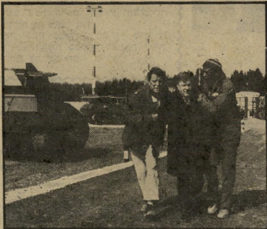
לאנקסטר ודרנינג — הנשיא נחטף