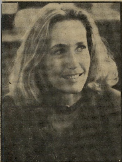
שחקנית בריגיט פוסי לנשום בין הסרטים

הנעות על פני כדור הארץ, בכל הכיוונים, ומעניקות לו את שיווי-המשקל וההרמוניה שלו".