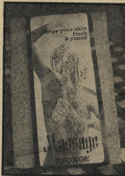
ספוג מוריד תאים אין דומה לו

לא צריך אבל להגשים כמו חברתי ה-שמנמנה. סיפרתי לה על הפנטז בבוקר, ומשבתה אצלה אחר-הצהריים — עוד מצאתיה מקרצפת בדבקות. מהה את עור-שה-י? נבלחתי. „הספוג הזה מוריד תאים, מה? ובכן, יש לי סבלנות!“