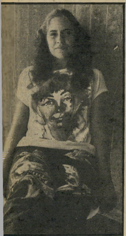
הבת עם הודעה מצויירת "העולם רואה..."