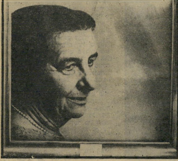
הציור של גולדה "הם נאבקו וניצחו..."

It took many years for my people to find their land - They have struggled and won - In Israel, the world now sees what can be accomplished by people with a purpose in life!