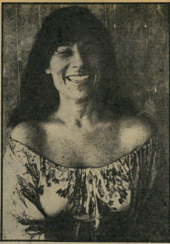
ציירת גלי "ייעוד בחיים..."