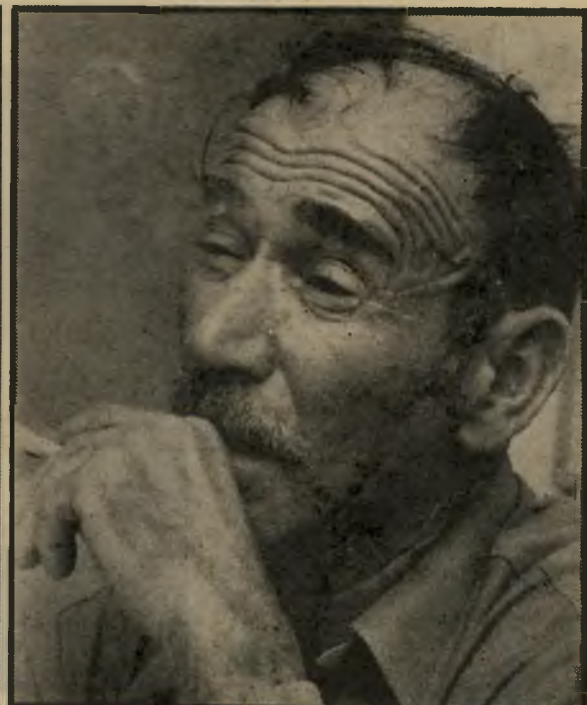
מתלונן זמיר גילוי המעילה

אדוני המפקח הכללי! שני האנשים הללו ועוד קצינים שדרכם רצופה בהתנהגות בלתי-מוסרית וידיהם מלאות טובות הנאה, ניצלו את מעמדם ודרגתם. האם הם יכולים לשמש דוגמא כלפינו וכלפי האזרח?"