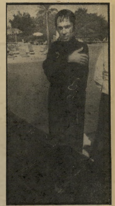
קוסם קדברה תחילת האגדה

סו, בדקו וחזרו ובדקו אם לתיבה אין דפנות כפולות ואם השק היה אימנם סגור, אבל לישוא. הכל נראה בסדר. וכאן נולד הודיני חדש.