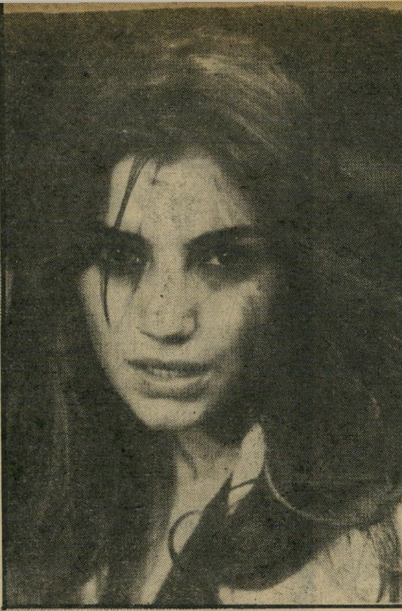
וקרוז בוקה ב"תשווקה אפלה" — והחצי הבתולי של אותה הגיבורה