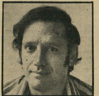
עורך עברון מארבים

לחברי מערכת החדשות ברור כי הן שניים יארבו לכל מעידה או נפילה של