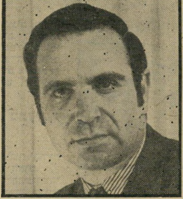
שר פת דאגה לשכנו