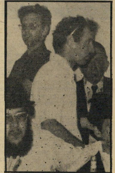
סרן אינדור — תחילה בדיקה של הרב —

מסתבר שתהליכי-הגיוס ליחידה ופרטים חשובים נוספים, הקשורים בפעילותה, נעלמו או הועלמו מידעתו של מייבסקי. כשהחליטה המישטרה לאשר את הקמת