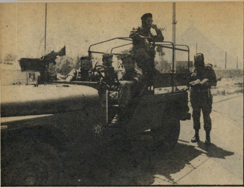
כיתת גושי-אמונים במישמר-הגבול וגם איתור מקומות להתנחלות

המגיעים מתאימים ליחידה מבחינה חברתית, או לא. אם הרב מחליט שהאנשים יכולים לשרת בקריית-ארבע, הוא מעביר את האנשים אל מאיר, שבדוק את יכולתם הצבאית ומפנה אותם לקצין-הגיוס של מישטרת ישראל..." מה קורה עם מגיע ליחידה חייל דתי, שאינו מזדהה עם האידיאולוגיה שאותה מייצגים מאיר אינדור והרב צבי אידלס? האם במקרה הזה תותר יחידת קריית-ארבע על שירותו, או שהוא יגויס כמו כל אחד אחר?