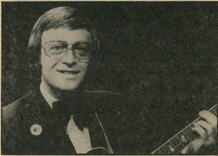
אריס סאן נאמנות מקומית

מה יהיה הסוף של הווג המורד הזה עוד לא ברור. אני רק בטוחה שהרבה בחורים הפעם הוא כולו שלה.