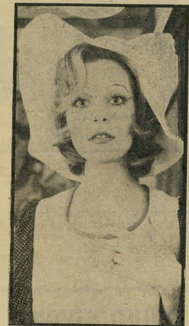
דוגמנית דונסקי מוזיאון פרטי בדירה

אנשי ההוצאה-לפועל עמדו מופתעים. מזה זמן רב שלא נודמן להם שלל כה רב