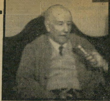
ויסנטה אלהנדרה במקום לורקה

בידי קלגסיו של פראנקו במהלך מלחמת האזרחים, בשנת 1936. הענקת פרס נובל למשורר ספרדי, חבי רוסלורקה, 41 שנים לאחר הירצחו, מעידה על הלך המחשבה המכתוב את הענקת הפרסים, בהתאם להנהיגות משרד החינוך וההשכלה הלאומי: שנה אחת לסופר שהבריה כתבים מברית המועצות; שנה אחריה למשורר חבר המפלגה הקומוניסטית הצ'יליאנית — וכאשר קיים קיפאון במטוטלת הבינגווינית, הרי שמצוי תמיד משורר איטלקי או צרפתי שנמצא ראוי לפרס. וכאשר מוצאים סופר ישראלי כשי עגנון ראוי לפרס, הרי שמוזר גים לו משוררת יהודיה גרמניה בשם גלי