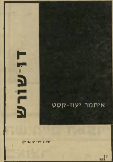
דו-שורש כפול שניים

טיפת דיו, חיובית או שלילית, לעברו של קסט, ולעבר הנוהים אחריו. אלא שבארץ טרם חוקקו את החוק נגד הוצאת מתים מקבריהם, והתעללות בהם בפומבי, כך שיעוץ-קסט יוצא נהנה מן ההפקר.