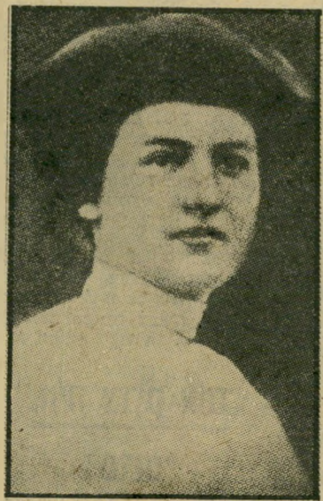
שרה אהרונסון התאבדה