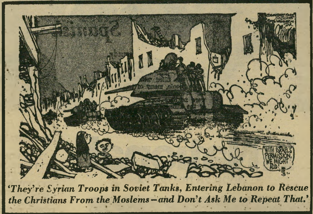
'They're Syrian Troops in Soviet Tanks, Entering Lebanon to Rescue the Christians From the Moslems - and Don't Ask Me to Repeat That.'