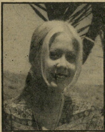
שוני חנני להביט בשוען

כך גם קרה בימים השישי האחרון, כשנער והוזהר רמנו נער קבע איתה פגישה. היא