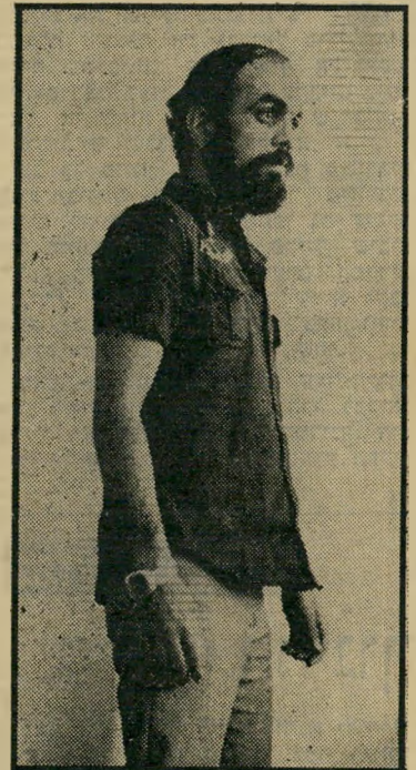
מוכה אצילי פה מלא דם

החזיק אותו! הוא יהרוג אותו! הוא השתגע! קבוצת החיילים המבוהלת התי-רוצצה בחוסר-אונים סביב הסמג"ד (סגן מפקדי-גדוד) סרן בריא-גוף שחבט בלא-רחם בחייל הכחוש החייל המוכה ועק בחוסר-אונים אך הסרן שנראה כאילו איבד את השליטה בעצמו. המשיך לחבוט באגר-רופיו בפניו שטופי-הדם של החייל, שהת-נווד כשיכור עד שקרס תחתיו. דראמה זו לא התרחשה בסרט. אלא בי-בסיס שיריון של צה"ל ברמת-הגולן, בחור-