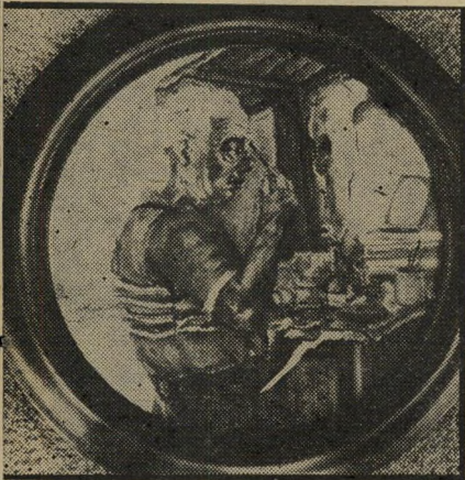
איפור לדין כל ציור — לידה

כאלה, כשהיד הימנית שלי כמו משוקת אבל הכוח היוצר דורש פורקן. אני כותבת. בינתיים לעצמי, אוספת מילים. עדיין לא כורכת אותן. אבל נהנית לפלרטט עם העט והנייר.