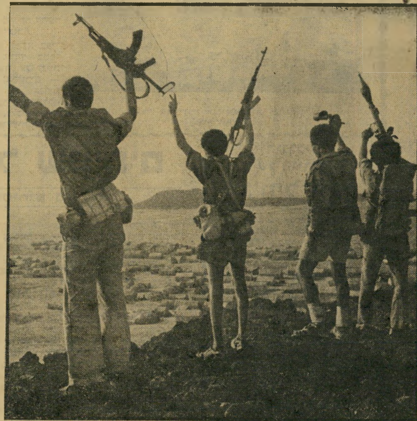
החזית הצפונית: לוחמים אריתראיים

המלחמה המזורה ביותר הנוטשה על עתה בעולם, היא זו המתחוללת עתה על אדמת אתיופיה. אנשי הכת הצבאית החבשית, בראשותו של הקולונל מנגיסטו מאריס, שהדיחו לפני שלוש שנים את קיסר חבש, מלך מלכי המלכים היילה סילאסי, נלחמים בשתי חזיתות. בצפון המדינה ובדרומה, הם מטילים לקרב את אחרוני כוחות המליציה העממית הבלתי מאומנת כדי לשמור על שטחי המדינה ההולכים ומצטמצמים מיום ליום. בדרום, במידבר אוגדן, נסוג צבא אתיופיה מפני הסומאליים, הטוענים לבעלות על המידבר רחב הידיים, המהווה כשליש משיטחה של המדינה. בצפון סופגים אתיופיים מפלה אחר מפלה בהתמודדות ארוכת השנים שלהם עם המורדים האריתראיים הטוענים לעצמאות אריתריאה. שלרעה, צבאות-מחרת שונים נלחמים