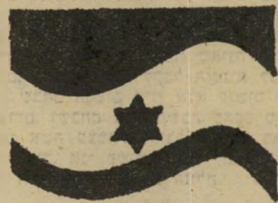
ציור כחול-לבן לשנת ה-30 למדינה

"הציירים והסופרים חייבים לקחת ללא שהייה סירים מלאי צבעים, ובמכחול