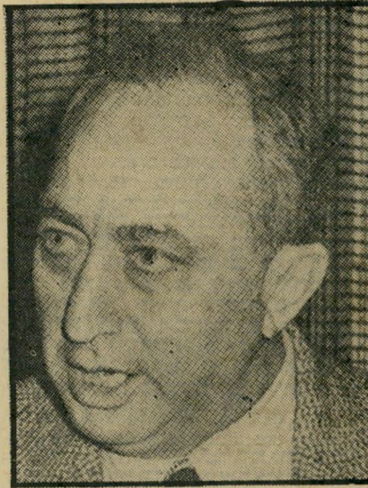
מנהל מקלף הכימיה עולה -

אחת החברות הכימיות הגדולות בגרמניה וכנסה לשותפות עם חברת-ההגן, כי-מיקלים לישראל, וביחד יפתחו מחדש את תישובת ערד במקום שבו עומד