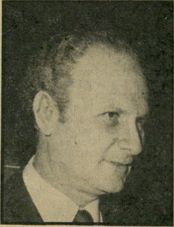
שופט שמגר מאה ימים

אם יוסכם כי השופט העליון מאיר שמגר יכהן כשר-המישפטים, הוא לא יוכל להתחיל בתפקידו אלא כעבור 100 ימים מהתפטרותו מתפקידו כשופט. ה-סיבה היא התיקון שהוכנס לחוק: יסוד הממשלה אחרי הצטרפות עזר ויצמן לממשלה ישירות מצה"ל. התיקון קובע כי דיין, שופט וקצין-צבא יכהנו כשרים רק כתום 100 ימים מאז התפטרותם מתפקידם הקודמים. מכאן שתיק המישפטים יישאר ללא שר לפחות שלושה חודשים ויותר אחרי ששמגר יתפטר מתפקידו. זהו משך זמן ממושך, שבו יכולה הממשלה ליפול ואז יישאר שמגר קרח משני הצדדים.