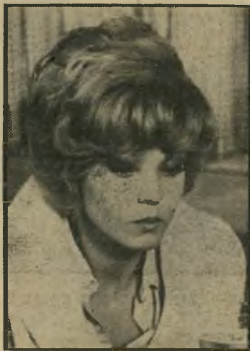
שחקנית-מישנה השנה: ברברה האריס „מזימות“, „נאשוויל“

אם כבר, תשל"ז יכולה לרשום לזכותה הישג אחד: במהלכה פרץ הסרט הפוליטי ורכש לעצמו מקום על בדי ישראל, במובן הטוב והרע גסייחד. מצד אחד, כל אנשי הנשיא הציג את העיתונות כמכשיר חיוני לשמירת הדמוקרטיה, ומצד שני השתדל הכבוד האבוד של קתרין בלום להראות את העיתונות כמכשיר זדוני מסוכן. המו" עמד התכוון לחשוף את האמת שמאחרי (המשך בעמוד 48)