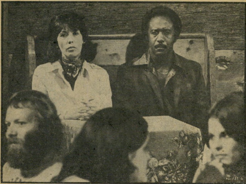
4. נאשוויל (ארצות-הברית)