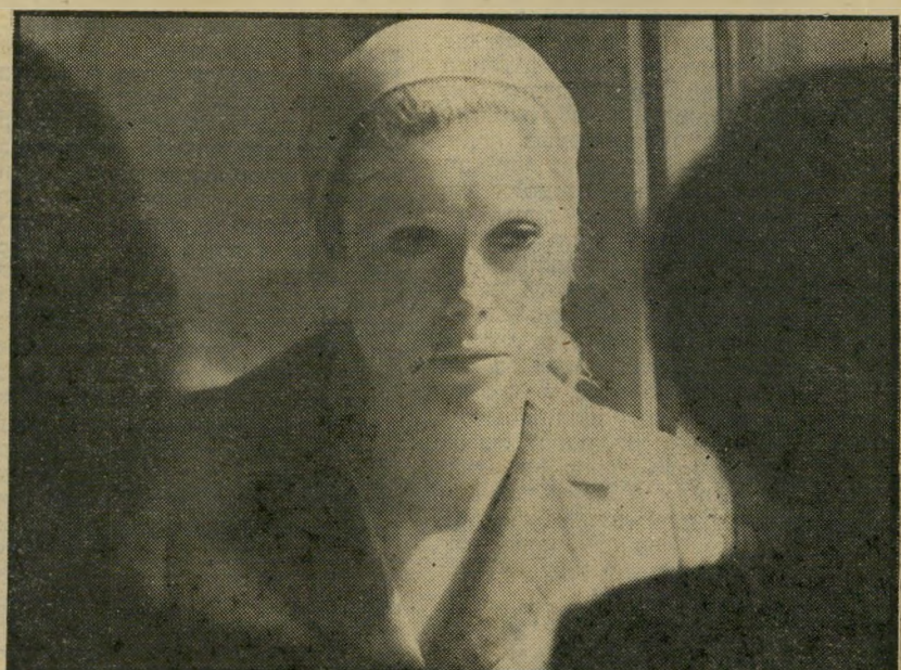
3. לחיות מחדש (צרפת)