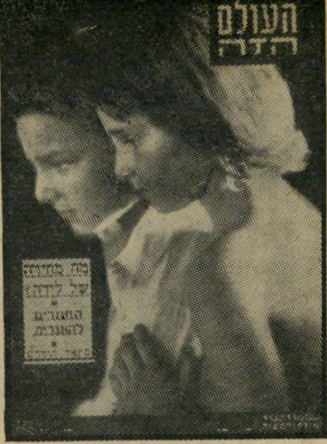
"העולם הזה" 778 תאריך: 25.9.52

הבעייה עם המיזרח-גרמנים היתה שהם סברו כי כל הרוצה מהם כסף חייב, לפי חות, להגיש בקשה. ואילו ממשלת ישראל ראתה בהימנע מכן, מטעמים פני-מיים. היא היתה מעוניינת שההצעה תבוא מאליה, מבלי שתצטרך לגקוף אצבע כי