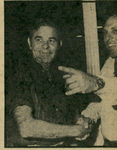
אבנרי ור"מ הליכוד רבטמן גוף מדן אחד נעלם -

להוציא. השיטון התחלק, אריה אבנרי החליף את ירדן בשוסטק. על כל פנים, עד להודאת ירדן הגן עליו אריה אבנרי כל העת, ולא היסט לתקוף את פירסומי העולם הזה, כשם שנהג לגבי עופר, ידידו של ירדן. עתה, בתארו את הפרשיות בספר, מסתבר שהוא עצמו היה בין העיתונאים שחקרו ושגילו, ואולי הוא גם מילא תפקיד מרכזי בחקירת הפרשיות. היה גם אחד יגאל לביב ושבווען העולם הזה, שמילאו תפקיד זר טר, בין שאר התפקידים השוליים שהיו כפרשית. תיאור מסוג זה של פרשיות יד לין ועופר, מצידו של מגינם הנלהב ביותר בעיתונות, בשעה שניהל מגעים עם ירדן על הוצאת ירחון-הבריאות, ראוי להוקעה. דוגמה קלה לסילוף משמעותי: אריה אבנרי מזכיר כי אהרון ברק, בדו"ח על