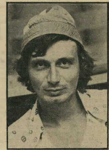
חייק משוחרר שמידר - נישל את הזכאי