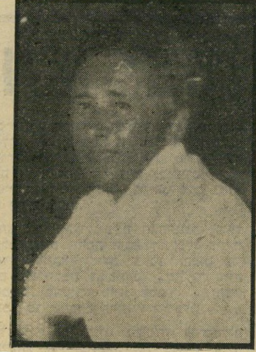
ראשי-ועד ליברמן - האיש החזק