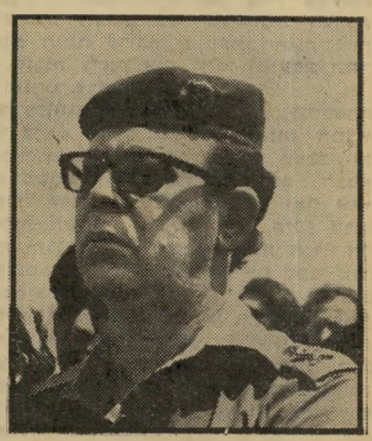
סופר גור, חופש סיפורתי קטן