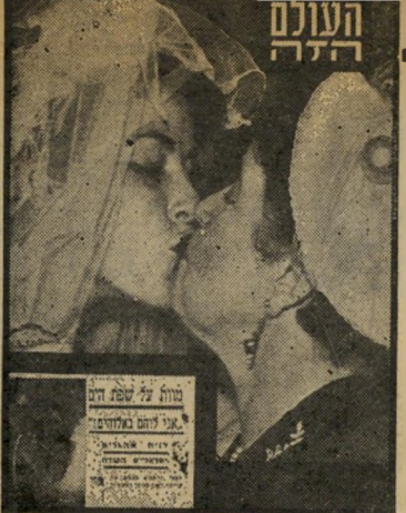
"העולם הזה" 775 תאריך: 4.9.52

את הרעיון הנועז בליבו. הוא לא דיבר על כך עם איש. הוא ידע שהוא מחזיק בפצצה העלולה למוטט את בניין הקר אליציה המפא"ית-דתית-מס'מת בעירייה ולעורר סערה חסרת-תקדים בארץ. לפצצה היתה דמות של איילה קטנה בסקיצה לפסל. כשביקר אבא חושי באר צות-הברית ראה את הפסלים הרבים של אנשי ציבור וגיבורים לאומיים הפזורים בכל ערי המדינה. הירר אבא חושי: מדוע לא נקים פסלים בעירנו, וגייפה בהם את גנינו וכיכרותינו?