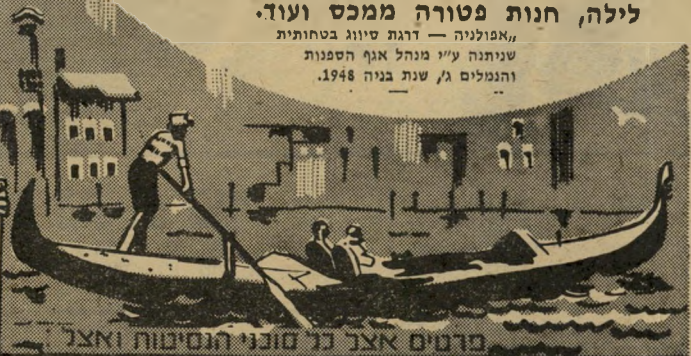
מרטוס אצל נרי סונוי הנוסיעות ואצל