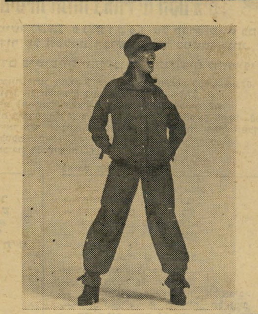
אורלי ב, ראש-אינדיאני" בדגם משגע