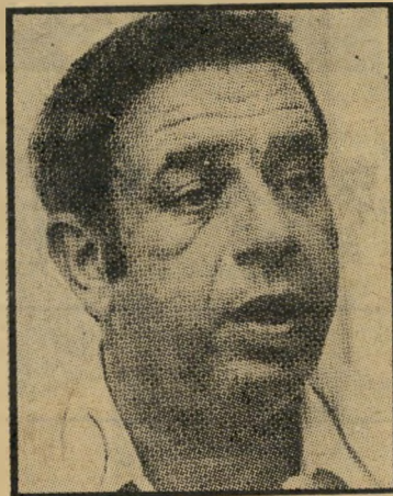
ניסאי שבימי בלי בדיקה

בחינה שנייה של ההסדר מגלה כי הוא דופק את התעשיינים בצורה חמו-