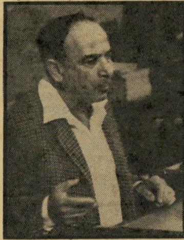
שר הורביץ אבקת קסם

בעיקבות ביטול הסובסידיות הותר ל- מחלבות לייקר את מחירי מוצריהן ב- 20 אחוזים בממוצע, כיוון שמחיריה- חלב התייקרו בשיעור דומה. "תנובה" ו-"טרה" משתמשות בחלב לייצור ניגרים, ואינן מרוויחות מתוספת המחיר. ה' מחלבות המאוחדות" משתמשות באב- קת-חלב. השר הורביץ דאג שלא להעלות את מחירו של זה (העולם הזה" 2086), אבל, "המחלבות המאוחדות" העלו, כמו כולם, את מחירי מוצריהן הניגרים. כך הן הגדילו באחוזים רבים את הרווח ממכירות מוצריהן הניגרים.