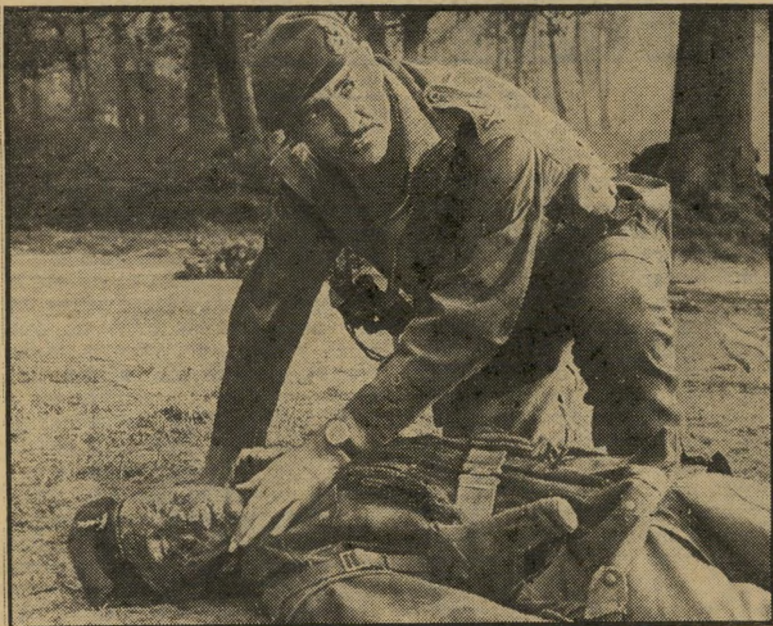
שון קונרי מחזיק בנהגו ההרוג "אני מבקש סליחה —"

(המשך מעמוד 53) לו על הפלישה, אינו מוכן להאמין אף לרגע שבנות-הזרית באו ללכוד את הר גשרים. "יש להם רק סיבה אחת טובה להגיע הנה — היא ללכוד אותי, אישית." אפילו הצלחתם של הגרמנים לעצור את המיבצע כולו היא, בסופו של דבר, מיקר רית. פילד-מרשאל פון-רונדשטדט, מפקד החזית המערבית הגרמנית, שולח רק בי-מיקרה את יחידת השיריוניות של גנרל ביטריך (מקסימיליאן של) לסביבות ארני-הם, ולא משום שהוא מנחש או יודע כי בטות-הזרית מתכננות שם התקפה. מילחמה נחמדה. תפקידו של הר במאי ריצ'ארד אטנבורו (שהוא גם שחקן ידוע אשר זכה בתואר אצולה על כישרו-נותיו) היה לשמור על האיוון בין המר-כיבים הרבים השונים של הסרט הזה,