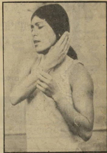
אסתר שהמורוביזט הפסד ברובע

האצנית הישראלית אסתר שהמורוביזט רוט היא כנראה נכס לאימי יקרי-מציאות. ולא משום ההשקעות תרתי-משמע שמש-קיעים בה מזה שנים לא-מעטות, אלא לפי קנה-מידה טלוויזיוני: גם כאשר היא מגיעה למקום הרביעי בדיסלדרף — בי-טלוויזיה אשר בירושלים שומרים לה את המקום הראשון. הטלוויזיה היתה כה גאה במקום הרביעי של אסתר רוט, שבחרה להעלות את מציאת המטרם המאכזבים